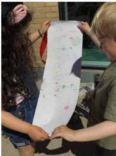
Børnenes flotte tegninger til Grundlovstalen illustrerer på en visuel måde, hvad børns rettigheder handler om.

om det gode miljø på legepladsen til gavn for netop insekterne.